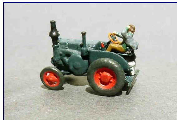
Gestaltungsbeispiel: Die Figur und die Milchkanne gehören nicht zum Lieferumfang!