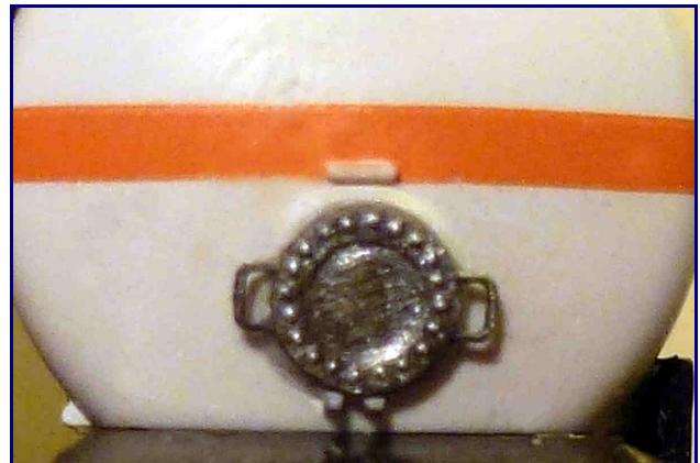
Modellansicht: Der Waggon, die Puffer und die Figur gehören nicht zum Lieferumfang!

Für Ihre Anfragen und Bestellungen benutzen Sie bitte unsere Email-Adresse: zpur@gmx.net